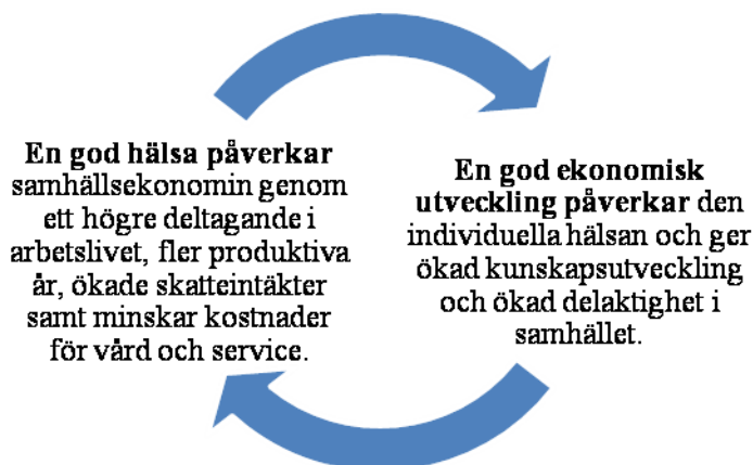
Figur 2 Samband mellan hälsa och ekonomi 25

Lönsamhet i hälsa måste ses på sikt. Med lönsamhet menar vi att invånarna upplever ökad livskvalité och att hälsan ökar samtidigt som att samhällskostnaderna minskar. Åtgärder för att förbättra folkhälsan kräver ofta särskilda investeringar, dessa kan leda till en så kallad kostnadspuckel. Men på sikt leder väl genomtänkta åtgärder till bättre hälsa och därmed även minskade samhällskostnader. 24