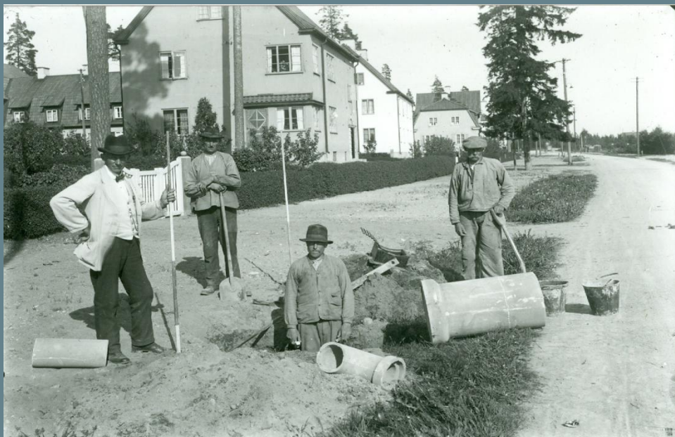
Rörläggning på Oppundavägen år 1924, källa kommunarkivet.