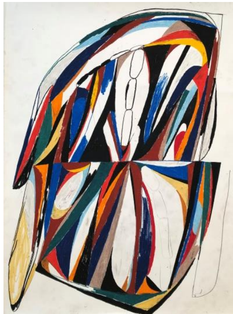
No one fig. Papper och pastellkrita

Drop fig. och No one fig. är två av sex verk som skapats av papper och pastellkrita. Verken namn kommer från dub genren, musik som skapas av bland annat en mix, ett kollage, av olika musikspår med förskjutningar och ekon. Fig. är en förkortning och betyder figur, form eller exemplar. Verken mäter ca 2 meter i höjd och Daniel Götesson arbetar med pappret på golvet. Genom den tekniken har han inte full kontroll och överblick i skapandet, bilderna växer fram i stunden utan förberedande skisser.