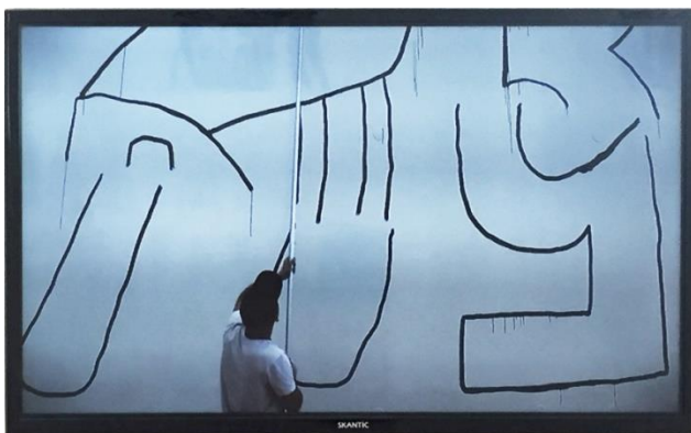
Spear through the days. Väggmålning med bläck och film