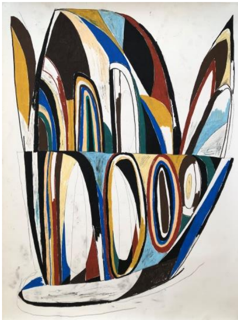
Drop fig. Papper och pastellkrita