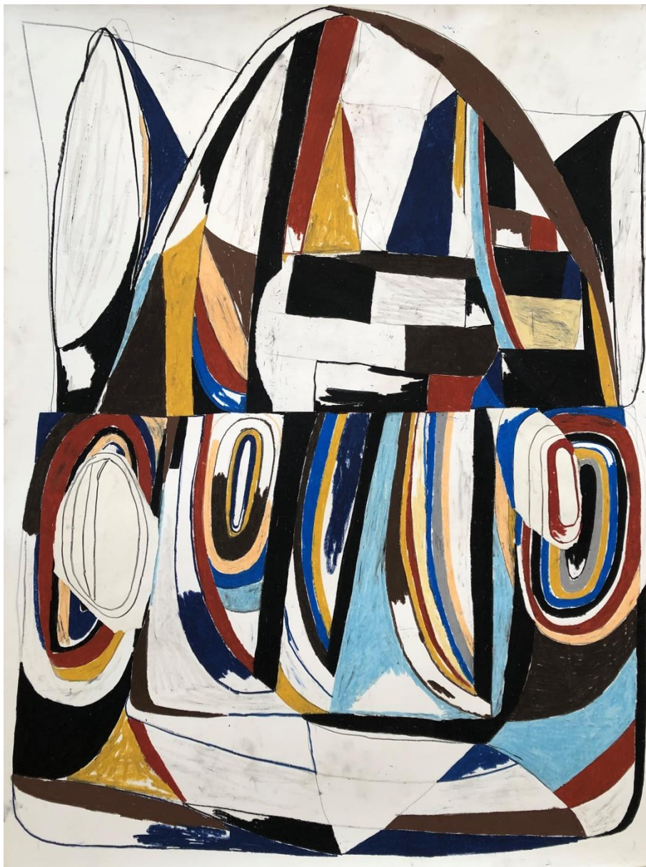
Hard time fig.