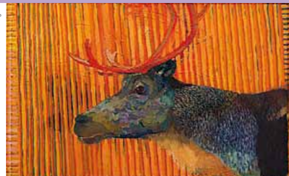
Eva Dahlin, Ren orange

Tisdag 21 september kl 18 – 20 Tisdag 28 september kl 18 – 20 Tisdag 5 oktober kl 18 – 20 Tisdag 26 oktober kl 18 – 20 Tisdag 2 november kl 18 – 20 Tisdag 30 november kl 18 – 20 Tisdag 7 december kl 18 – 20