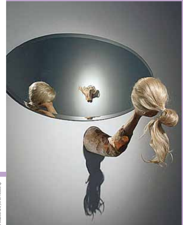
Omslagbild Inka Nieminen. So beautiful and yet so messed up