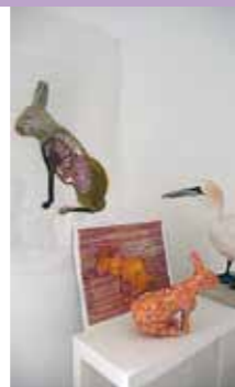
Eva Dahlin, Here rum installation