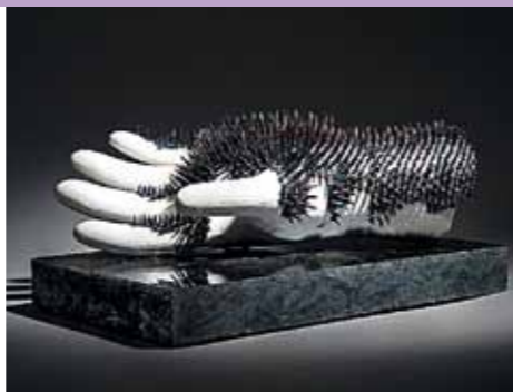
Åsa Palmaer Skoglund